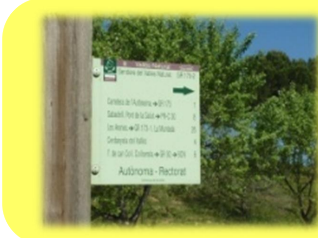
3. Ruta groga. Un GR molt il·lustrat (2,8 km)