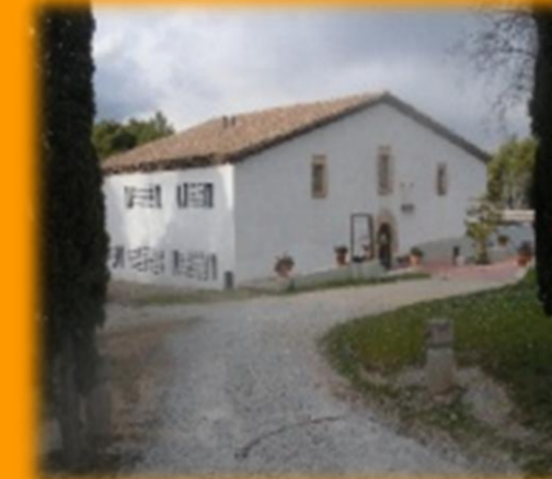
2. Ruta carabassa. L'antic camí a Can Miró, Ho Chi Minh i altres històries (2,3 km)