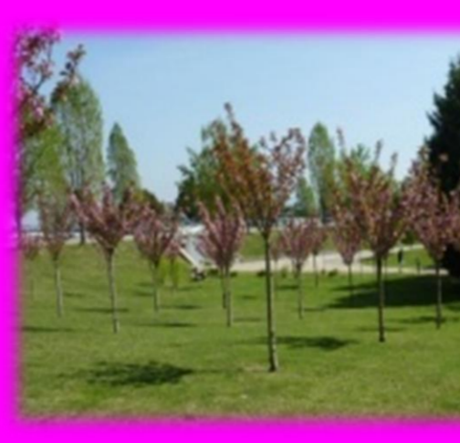
4. Ruta magenta. Racons entre l'acadèmia (2,3 km)