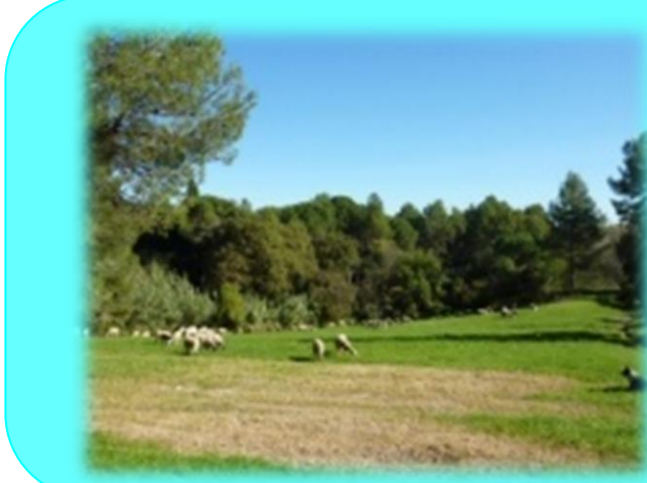
1. Ruta blau cel. Entre bosc i conreu (2,2 km)