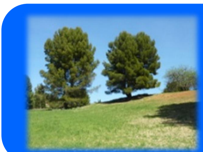
5. Ruta blava. Itinerari de natura de Can Magrans (1,7 km)