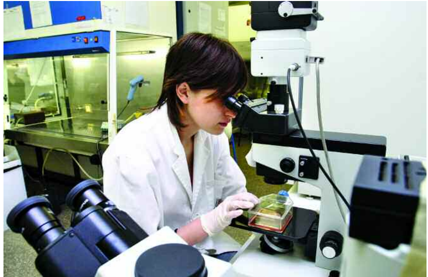
Els laboratoris de l'SCC estan situats a l'Institut de Biotecnologia i de Biomedicina «Vicent Villar i Palasí» (IBB).

La necessitat dels grups de recerca de la UAB de disposar de cèl·lules eucariotes en cultiu per a la seva activitat investigadora va donar peu a la creació del Servei de Cultius Cel·lulars (SCC) de la UAB, un servei universitari especialitzat que es dedica a la preparació i el manteniment de cultius de cèl·lules animals i humanes que requereixen una cura especial. Els