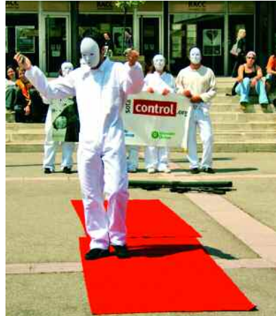
Espectacle "Desfilada d'armes", d'Intermon-Oxfam.

Durant aquesta I Setmana de la Cooperació, es va oferir a la comunitat universi-