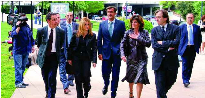
El ministre Juan Fernando López Aguilar (al centre), arribant a la Facultat de Dret de la UAB el 20 d'abril passat.

El ministre va defensar les lleis que han permès eliminar discriminacions en el dret de família, i va afirmar que el matrimoni entre persones del mateix sexe forma part de la llibertat i del pluralisme