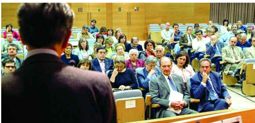
La UAB va ser la primera universitat que va convidar Sánchez-Albornoz quan va tornar de l'exili el 1976.

➤ Les aportacions acadèmiques i el compromís cívic i social li han fet merèixer aquest reconeixement