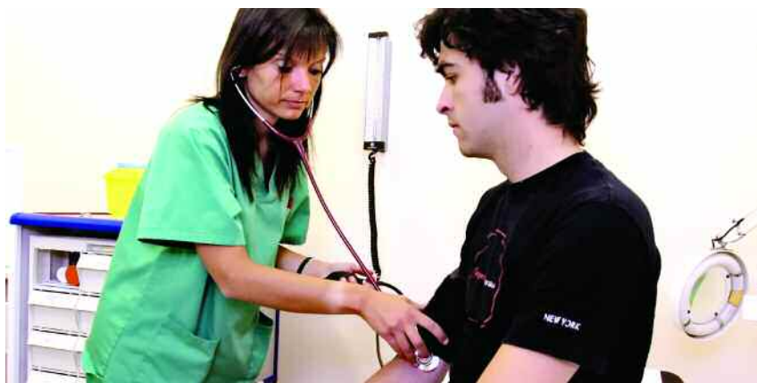
Les trucades d'auxili es reben a la recepció del SAS i es deriven amb urgència a una infermera o un metge.

L'origen de les trucades més freqüents ha estat el Servei d'Activitat Física (SAF), amb 33 trucades fetes des d'aquest servei, seguit de la Facultat de Filosofia i Lletres, amb 23, i la Facultat de Ciències de l'Educació, amb 13. El mes de novembre, amb 30 trucades, ha estat el mes que el SAS n'ha rebut més, seguit del març (amb 20),