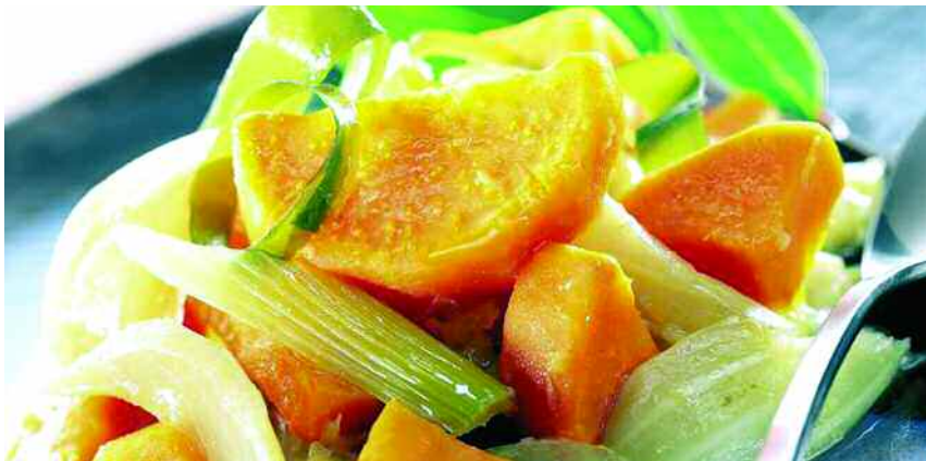
Els aliments funcionals són aquells que contenen components biològicament actius beneficiosos per a la salut.

➤ El projecte, emmarcat dins del programa CENIT, implica quatre universitats i vuit empreses privades