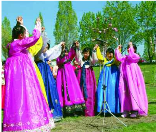
Inauguració del jardí oriental al davant de Ciències de l'Educació.

El 26 d'abril es va projectar la pel·lícula Morning sun , un documental que Barmé va dirigir juntament amb Carma Hinton i