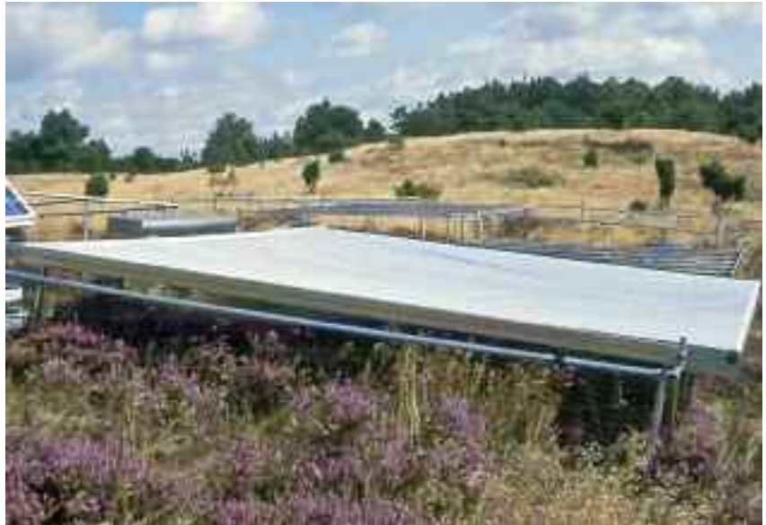
Les respostes de les plantes a l'escalfament i a la sequera depenen del país, de l'estació de l'any, de l'espècie, etc.

Els científics van trobar respostes molt diferents segons l'espècie vegetal estudiada en una mateixa zona. Així, per