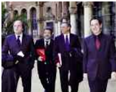
Els rectors Gabilondo, Moreso, Peña i Ferrer.

El primer objectiu de l'acord és la creació d'un programa d'intercanvi dirigit a doctors de les quatre universitats. Així, cada universitat es compromet a oferir estades de recerca a cada una de les altres tres universitats. En segon lloc, aquestes