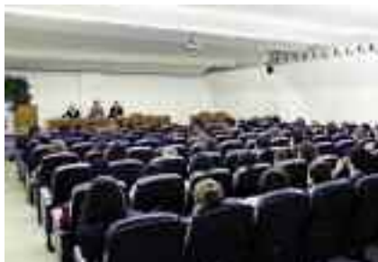
Sessió d'acollida a la Facultat de Ciències.