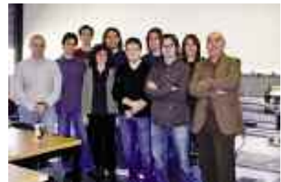
El grup investigador del CIMITEC.