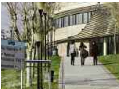
La Facultat ha format 21 promocions de veterinaris.

La Facultat de Veterinària de la Universitat Autònoma de Barcelona ha rebut un certificat de l'Associació Europea d'Institucions d'Educació en Veterinària (EAEVE), en reconeixença de la seva qualitat com a institució docent. La distinció va ser acordada pel Comitè Conjunt d'Educació de l'EAEVE i de la Federació