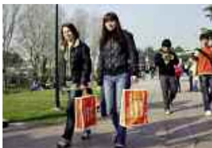
Els estudiants van poder conèixer el campus.