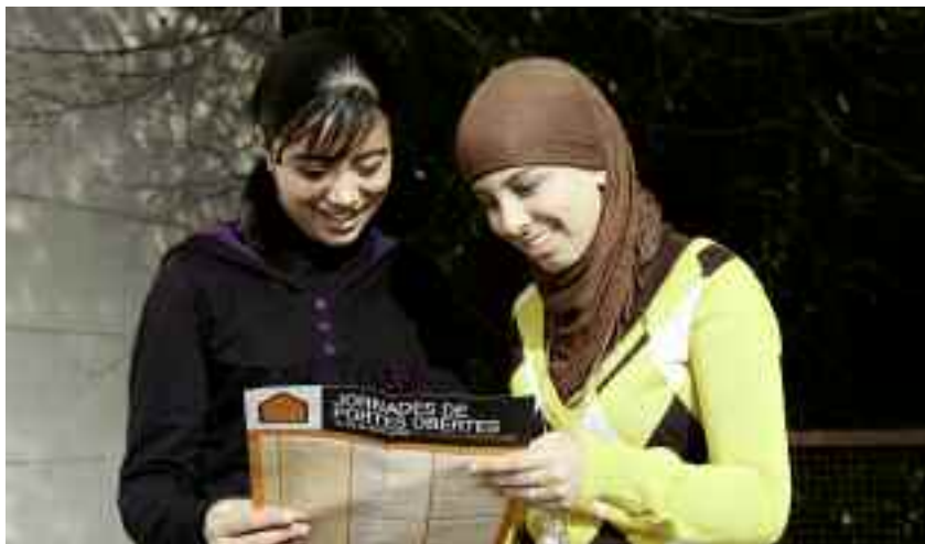
Els joves s'informaven sobre les característiques de les titulacions a cada centre.

D'altra banda, tots els estudiants que van venir a les Jornades de Portes Obertes o els que vinguin a qualsevol de les Visites al Campus poden participar en el concurs fotogràfic Campus UAB (el centre d'origen s'ha d'haver inscrit en alguna d'aquestes dues activitats). S'admetran fotografies en format digital fetes amb qualsevol tipus de càmera, fins i tot les