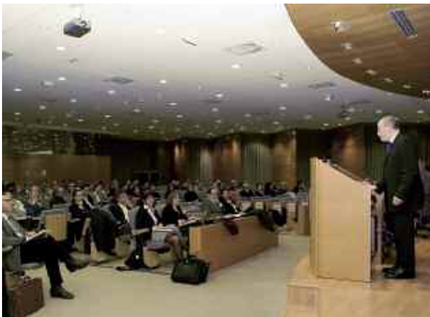
El seminari es va desenvolupar al llarg de diferents sessions de matí i de tarda.