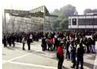
La plaça Cívica es va omplir de futurs universitaris.