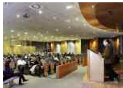
El Rectorat també va oferir sessions d'acollida.

dels telèfons mòbils. Les fotografies han de fer referència a algun indret del campus que agradi a l'autor o a un fet o un moment de la seva experiència durant la visita. El primer premi serà un iPod de 80 GB, el segon, un iPod nano de 8 GB i el tercer, un iPod Shuffle d'1 GB.