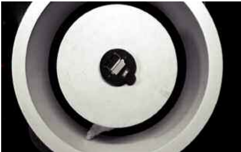
Els animals criats en ventrades més grans mostren un comportament menys ansiós quan són adults.