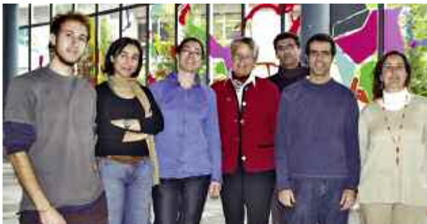
El grup pertany al Departament d'Antropologia Social i Cultural i va iniciar, el 2002, una línia de recerca inèdita a Espanya.

L'equip, que forma part del Departament d'Antropologia Social i Cultural, va iniciar aquesta línia de recerca inèdita a