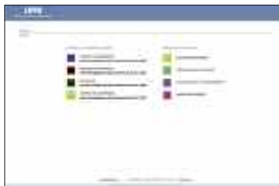
El Datawarehouse facilitarà molts tipus de gestions.

Properament, s'elaboraran materials informatius per donar a conèixer les utilitats i el funcionament del Datawarehouse . També es faran sessions per ensenyar a utilitzar aquesta nova eina.