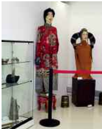
Un detall de l'exposició.

Van intervenir en la inauguració oficial de l'exposició el rector de la UAB, Lluís