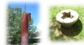
Ars longa vida brevis (esquerra) i enclavament de Bellaterra (dreta)

22 min. A través d'aquest bosc ombrívol de pins blancs, girant a l'esquerra, arribem a la plaça Cívica. Baixem per l'ampla rampa de fusta paral·lela a l'eix Central i, tot seguit, girem a la dreta cap a la riera de Can Magrans. Abans d'arribar-hi, ens trobem l'escultura Ars longa vida brevis de Miquel Navarro, feta el 1988 per commemorar els vint anys de vida de la Universitat. Ens arribem a la riera, que travessem pel pont de fusta. Just a l'altre vessant, a la dreta, ens trobem l'escultura Enclavament de Bellaterra , un cargol de bronze enclavat a terra del qual sobresurt la cabota, obra de Perejaume.