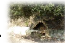
Restes d'un forn

Seguim per la nostra dreta. Passem pel costat d'un camp de conreu a la nostra esquerra. Si ens hi fixem podem veure les restes d'un forn que data dels anys vuitanta.