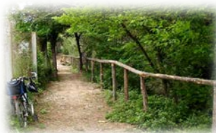
Via Verda del Vallès en el tram inicial de la ruta blau cel

3 min. Arribem al pont que creua per sobre les vies del tren i pel qual continua la Via Verda (1). Abandonem aquesta via i seguim endavant, deixant una pista a la dreta. A l'esquerra podem veure la cotxera d'autobusos de la UAB. Ben a prop trobem un camp de pastura on sovint va el ramat. Hi ha restes d'una casa d'estiueig al costat d'uns xiprers que fan de paret vegetal a una palmera molt bonica. És el racó de la calma (2), un bon lloc per a reposar. Si ens en separem una mica avançant uns metres cap a llevant veurem a un nivell inferior un extens camp de conreu ( el camp de l'hort ).