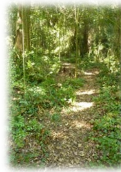
Entrada al bosc de Bellaterra

17 min. Pla de Can Domènec. Uns metres abans haurem deixat un corriol que enfila cap a la dreta i que ens portaria a la torre Vila-Puig. Entrem a una zona de conreu on abans hi havia la masia de Can Domènec. A la nostra esquerra podem observar entre unes figueres les restes del que, suposadament, era una bassa per al bestiar. A la dreta veiem una extensa zona de conreu. Girem a l'esquerra i baixem cap a la riera de Can Domènec tot passant pel mig d'un alzinar. Uns 100 m més enllà deixem la ruta vermella, que gira cap a la nostra esquerra.