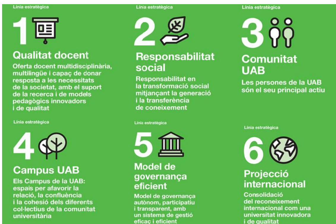
Figura 2. Representació gràfica de les línies estratègiques de la UAB.