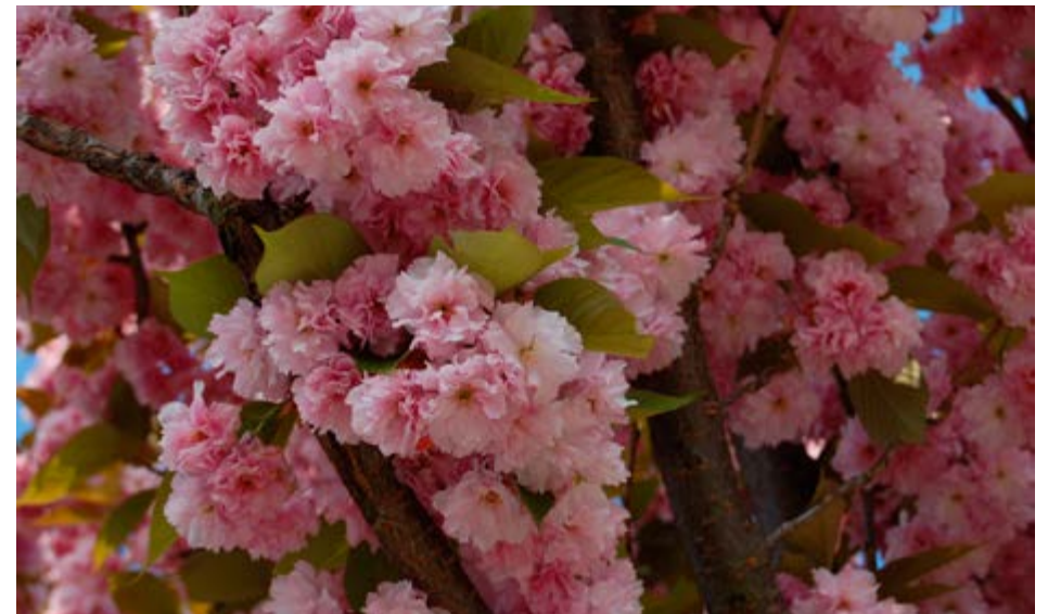
Detall de les flors del cirerer del Japó