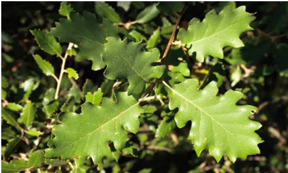
Detall de la fulla de Quercus humilis

Quina espècie d'arbre predomina en aquest punt?