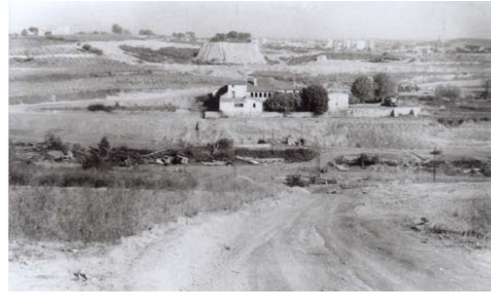
Can Magrans al segle XX