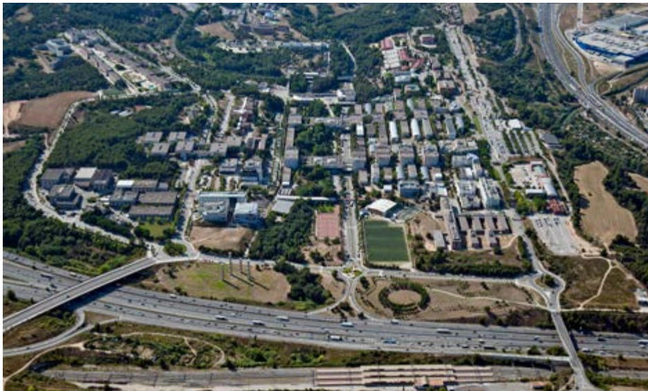
Vista aèria del campus de Bellaterra, 2014