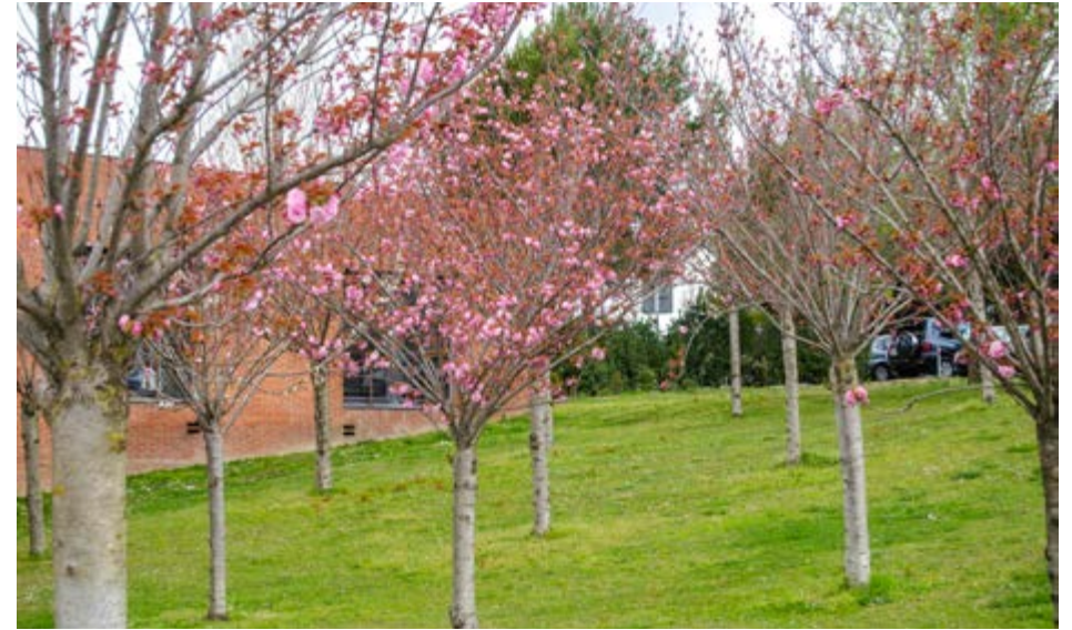
Jardí oriental, al costat de la facultat de C. de l'Educació