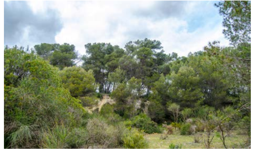
Imatge del turó de Sant Pau