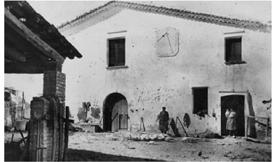
Can Miró als anys 30 del segle XX