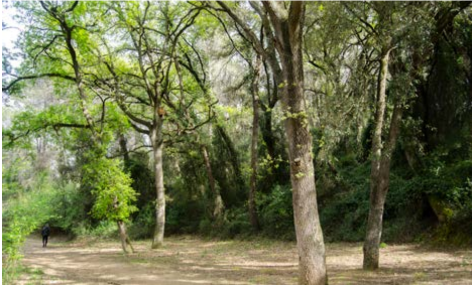
Vista actual (2018) de la roureda