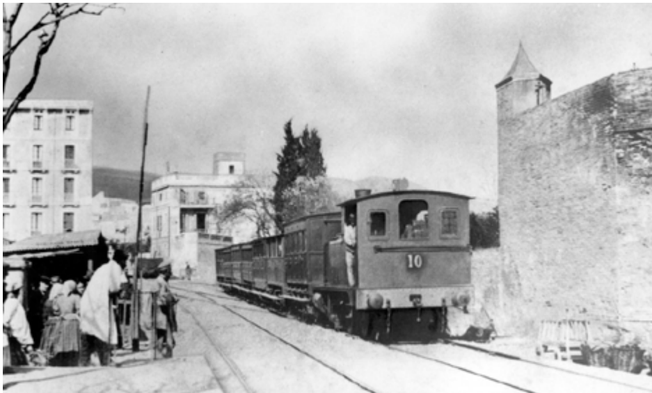
Imatge del segle XX dels ferrocarrils catalans (font:FGC)