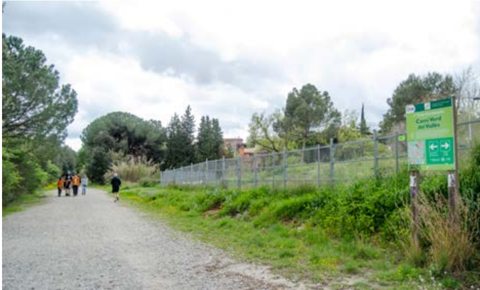
Vista actual (2018) de la Via Verda