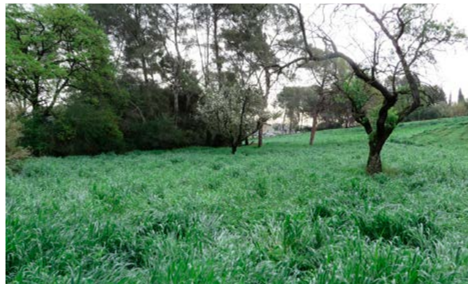
Camp de Villa Aurora