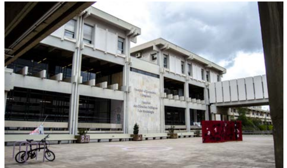
Facultat de Ciències Polítiques i d'Economia al 2018