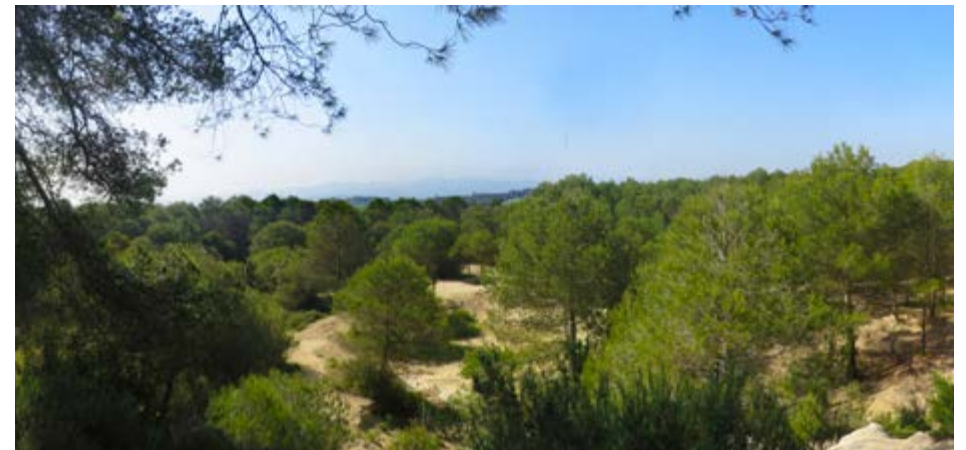
Vistes des del turó de Sant Pau