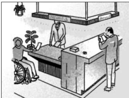
Esquema de taulell

El Reglament de Barreres Arquitectòniques en l'annex 2, punt 2.4.6 sobre mobiliari d'ús públic diu que els taulells que siguin d'un metre d'alçada han de disposar d'una part més baixa, accessible a les cadires de rodes.