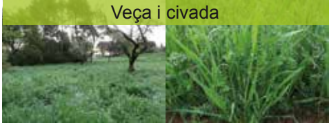
Veça i civada

Pla de gestió dels espais agroforestals del campus de la UAB (PGAF)