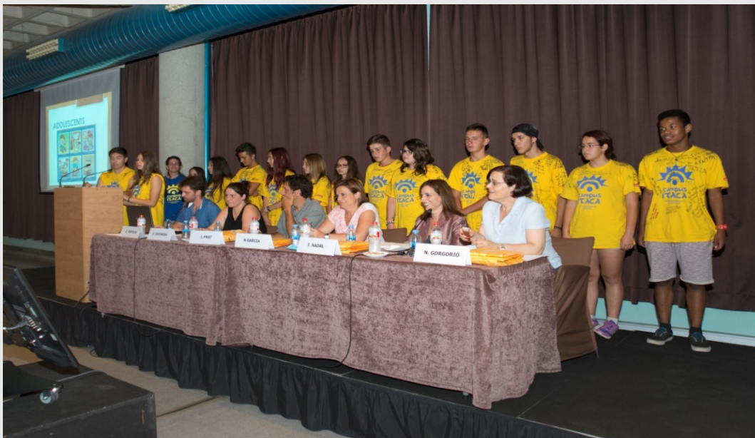
Acte de cloenda del segon torn del Campus Ítaca al 16 de juliol de 2015

Dades disponibles del programa Campus Ítaca posen de manifest que: