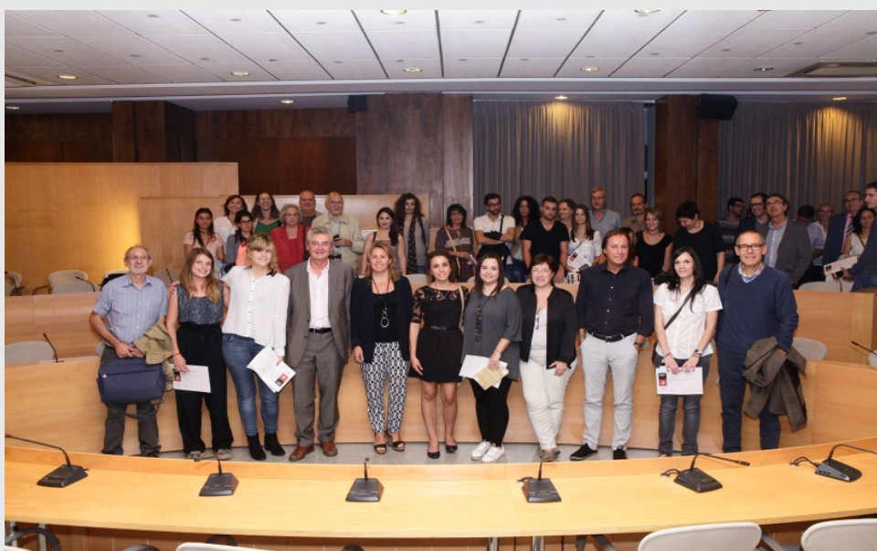
Acte de lliurament de la 12a edició del Premi Argó a treballs de recerca de Cicles Formatius de Grau Superior

Les darreres dades disponibles del programa Argó posen de manifest que el 25% de l'alumnat que hi participa, continua estudiant a la UAB després d'acabar l'etapa d'ensenyament secundari obligatori.