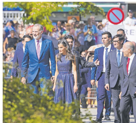
La visita dels reis d'Espanya va despertar una gran expectació als carrers de Badia del Vallès

Durant el matí, els monarques van visitar també l'Abadia de Montserrat en el seu Mil·lenari. La celebra-