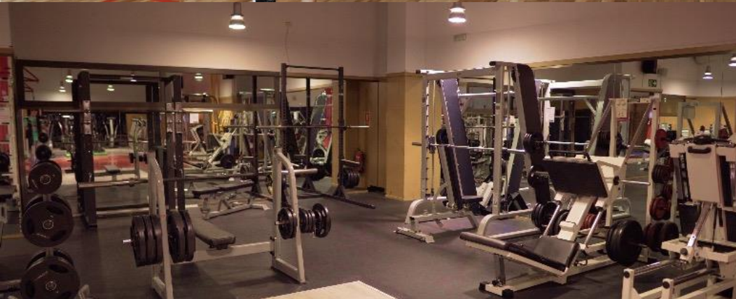
SALA FITNES (que ampliarem aquest curs)