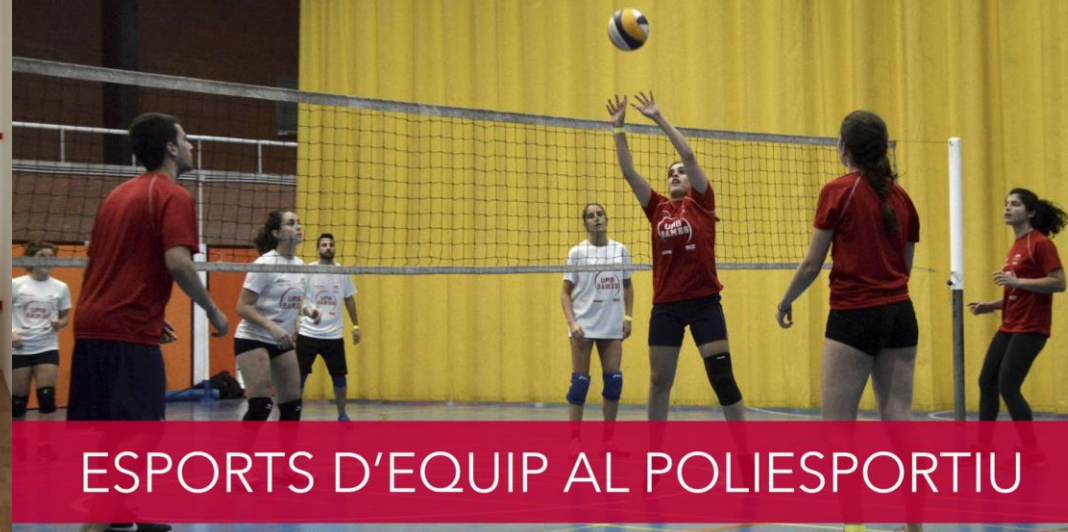
ESPORTS D'EQUIP AL POLIESPORTIU