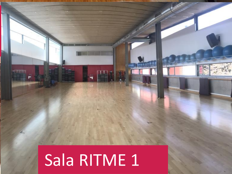
Sala RITME 1