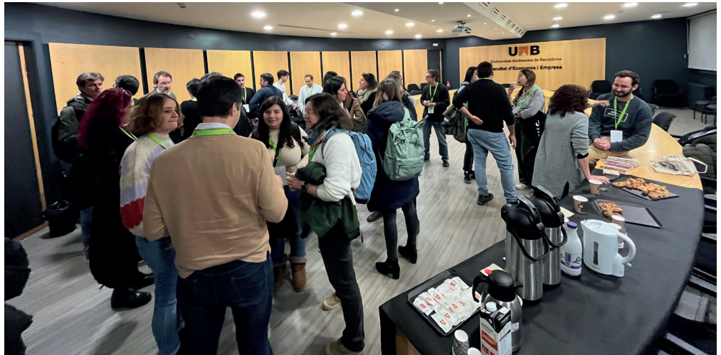
Networking de persones mentores. Gener '24

“Ara tinc en compte aspectes que abans no tenia presents i que poden ser un factor clau a l'hora de trobar feina”