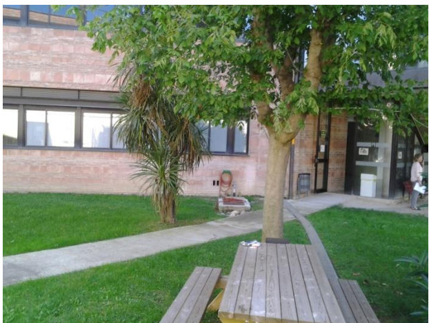
Sortida accés búnquer (Deganat)