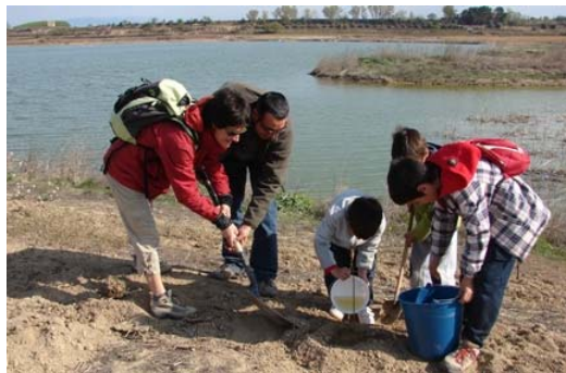
Plantada a l'Estany d'Ivars

Els experts de la Fundació van vetllar perquè tots els arbres plantats fossin xeròfils, és a dir, que tinguessin baixos requeriments hídrics.