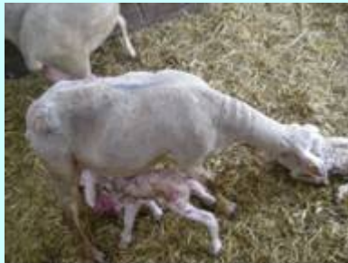
Foto. Ovel·la Lacauna amb dues cries cinc minuts després del part

Durant el mes de setembre , cal destacar els parts de les ovelles de llet (les manxegues i les Lacaunes) i també de les cabres. Pel que fa a les ovelles, es fan tancats petits perquè vagin parint i es vigila que les cries mamini durant unes cinc setmanes. Pel que fa a les cabres, les cries són separades de les mares i s'alleten de manera artificial, tal com es fa a les granges d'arreu del país.