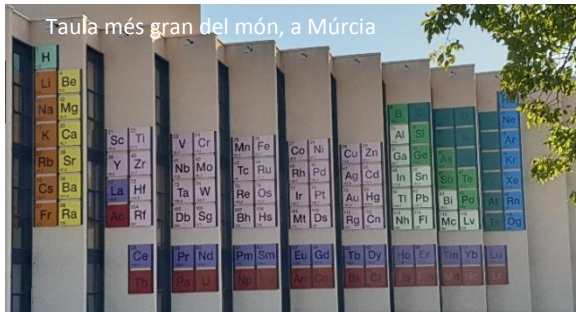
Taula més gran del món, a Múrcia