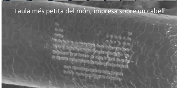
Taula més petita del món, impresa sobre un cabell